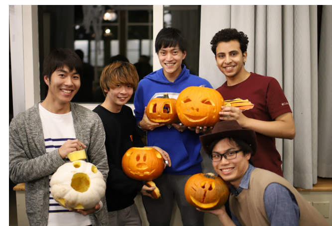
Pumpkin Carving Event