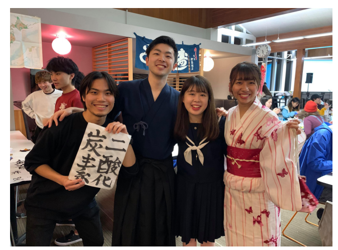
Celebrating Japan Night